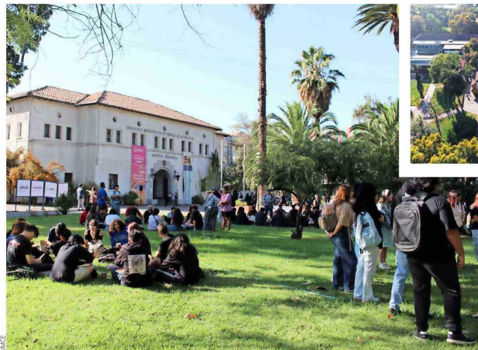
La UMCE es un referente en la educación pública chilena.

“La apertura de estas carreras se enmarca en un plan progresivo de ampliación de la oferta académica. Se trata de dos profesiones que son fundamentales para abordar las complejidades crecientes de la