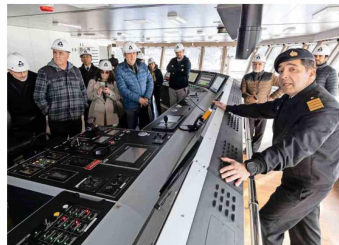
Delegación conoce detalles de la sala de control del buque.