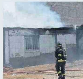
LAS LLAMAS AFECTARON A DOS VI-

Doce damnificados dejaron ayer un incendio, que afectó a dos viviendas ubicadas en el sector centro norte de Antofagasta.