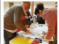
SE EFECTUARÁN TALLERES.