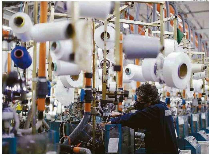
LA BAJA EN LA OCUPACIÓN DEL SECTOR DE LA INDUSTRIA AFECTÓ EN ESPECIAL AL EMPLEO MASCULINO.