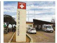
MURIÓ EN EL HOSPITAL DE QUILPUÉ.