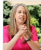
La embajadora de EE.UU. dejará Santiago por el cambio de mando en Washington.

Las debilidades del test psicológico de Conaf que aprobaron los acusados por el siniestro que originó la tragedia en Viña y Quilpué. | C 11