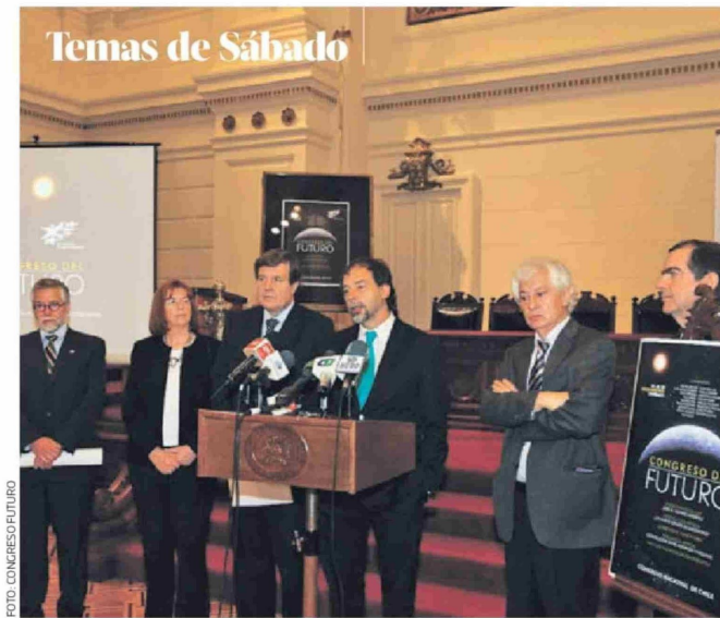
► Guido Girardi, al centro, durante el primer Congreso Futuro, en 2011.