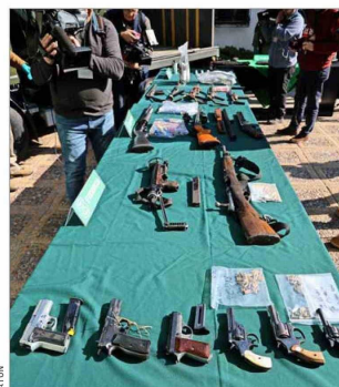
Incautaciones de armas de grueso calibre, y también arrestos, fueron ajustados a derecho, afirmaron en Carabineros y la fiscalía.