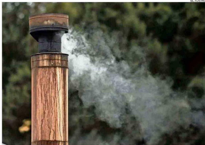
EL AIRE ES IRRESPIRABLE CUANDO LA TEMPERATURA SE PONE MÁS BAJA EN OSORNO Y NO HAY VENTILACIÓN.

más viviendas se han fiscalizado que otras fuentes fijas de emisión, como edificios o industrias, de acuerdo a los datos de la Seremi de Salud de este año.