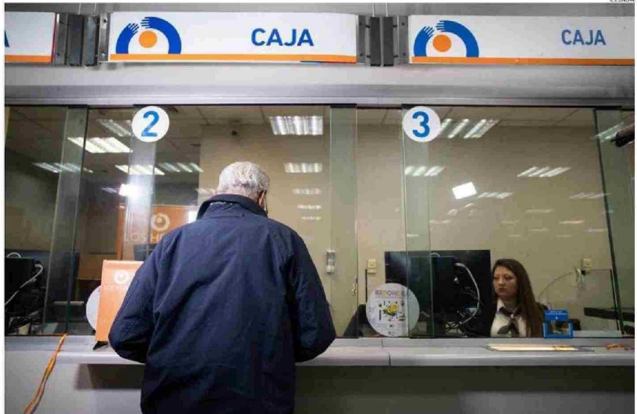
MEJORAR EL SISTEMA DE PENSIONES ES FUNDAMENTAL PARA EL DIPUTADO JAIME SÁEZ.

Para los legisladores del distrito 25 los ejes a resolverse del próximo año abarcan la seguridad pública, la creación de empleos, mejorar los servicios de salud, ampliar los servicios de agua potable rural y la apertura de caminos para mejorar el bienestar social.