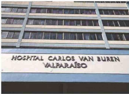
DESDE EL HOSPITAL PORTEÑO NO EXISTIÓ RESPUESTA AL CASO.

Sin perjuicio de ello, “al no recibir tan buena