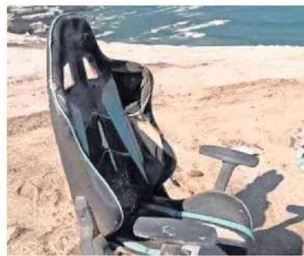
LA PRESENCIA DE BASURA Y DESECHOS EN LA PORTADA.

En el video, el tiktoker manifiesta que "este podría ser uno de los monumentos naturales más lindos de Chile. La-