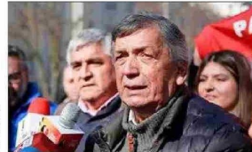
El presidente del PC, Lautaro Carmona, cuya comisión política solicitó un "gran acuerdo nacional" para combatir el crimen organizado.