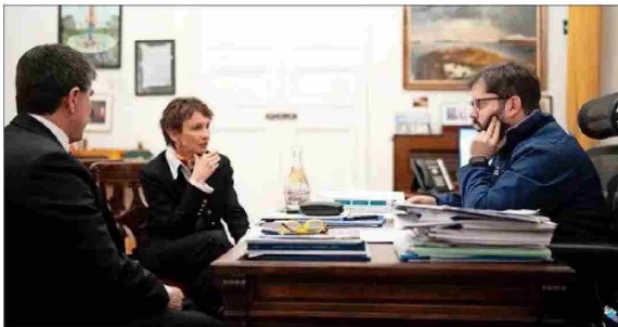
El Presidente Boric llegó desde Paraguay ayer en la tarde y se trasladó a La Moneda a reunirse con la ministra del Interior, Carolina Tohá, y el subsecretario Manuel Monsalve, en el Palacio de la Moneda, para ponerse al tanto de las acciones que tomará el Gobierno.

Dentro de las propuestas que más llamaron la atención estuvo la de la comisión política del Partido Comunista, que pidió "un gran acuerdo nacional" con el objetivo de "enfrentar y erradicar el crimen organizado y el