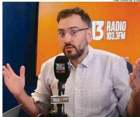
CAPTURA DE VIDEO

3 de marzo nació el hijo de los diputados De Rementería y Cariola, mismo día del allanamiento.