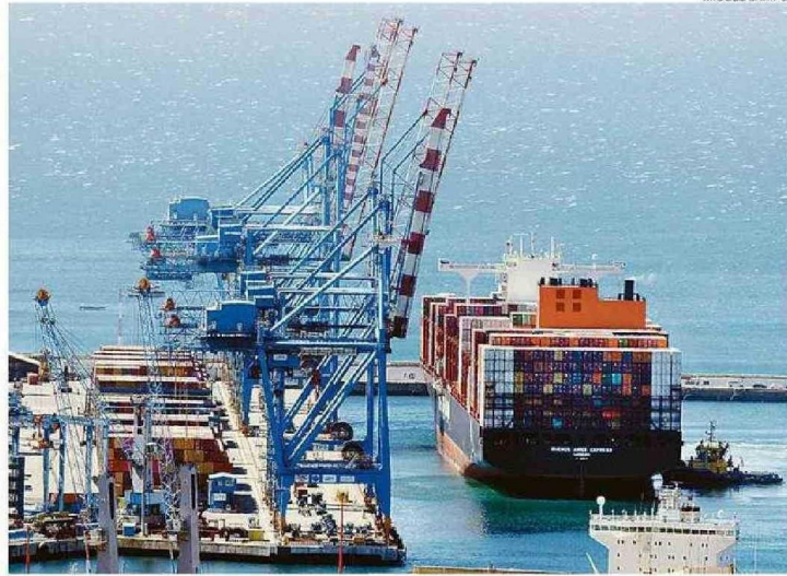
PUERTOS DE VALPARAÍSO Y SAN ANTONIO TRABAJAN EN LA AMPLIACIÓN DE SU CAPACIDAD DE CARGA.

También recaló la relación ciudad-puerto, “donde los esfuerzos para mejorarla deben enfocarse en proyectos de