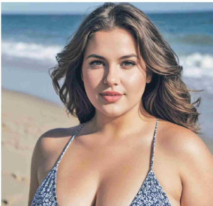
► Amanda García Miller fue creada en septiembre de 2024.