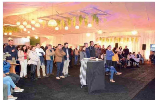
LA PERMISOLOGÍA IMPUESTA por el órgano público fue vista como una de las trabas para la atracción de proyectos de inversión y reactivación de una economía vista transversalmente como decaída.