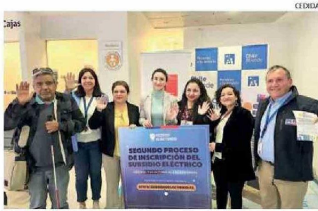
AUTORIDADES HICIERON EL LLAMADO A POSTULAR AL SUBSIDIO.

El plazo final para postular al beneficio es hasta el 6 de noviembre en www.subsidioelectrico.cl