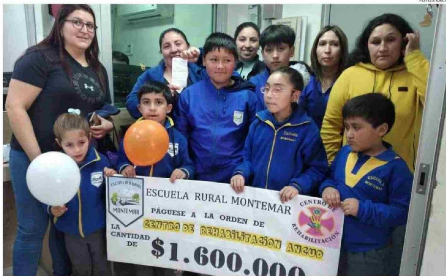
LOS NIÑOS DE SECTORES RURALES TAMBIÉN SE PUSIERON CON LA CAMPAÑA DEL CLUB DE LEONES.

“Lo más importante es que la comunidad superó la meta. Estamos felices”.