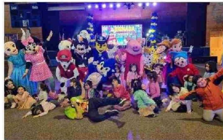
HUBO UN ESPACIO ESPECIAL PARA LOS NIÑOS EN SHOW EN ANCIUD.