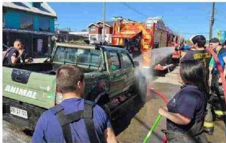
LAVATÓN DE LOS BOMBEROS EN CHONCHI.

Hasta a eso de las 3 de la madrugada se extendió el show de cierre de esta actividad solidaria que se realizó en el gimnasio del Colegio Seminario Conciliar en Ancud, y que consideró la presentación de artistas locales, así como del resto del país, además de la entrega de los aportes recaudados por las distintas instituciones que se sumaron a la jornada. ☺