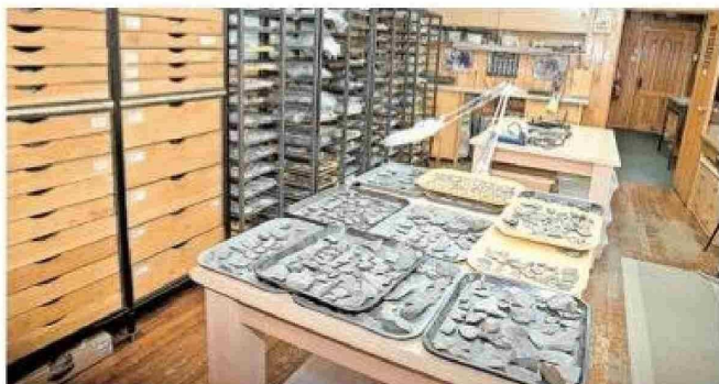
Laboratorio de micro paleontología.

"Nosotros decimos que no puede haber desarrollo sin conservación, pero tampoco puede haber conservación sin desarrollo. Deben ir de la mano".