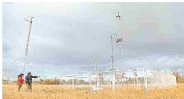
Dentro de las instalaciones se encuentra la estación climática Jorge Schythe.