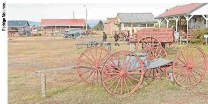
En el recinto existen antiguos tractores y carretas de principios del siglo XX.