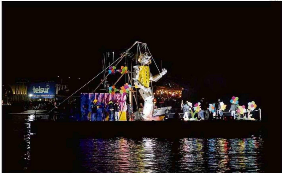
A LAS 21:30 HORAS DE MAÑANA ESTÁ PREVISTO EL INICIO DEL CORSO FLUVIAL POR LAS AGUAS DE LOS RÍOS VALDIVIA Y CALLE CALLE.

competirán en el curso fluvial, que entregará premios en dinero a los tres primeros lugares de cinco categorías. Los montos van desde $1.400.000 a $2.800.000.