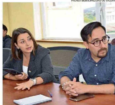
AYER FUE LA REUNIÓN DE COORDINACIÓN DE SEGURIDAD.

Ante la realización de este evento, tanto Carabineros como el municipio dispondrán de stands en los que se entregará pulseras de identificación a niños y personas mayores, con el fin de facilitar su reencuentro con familiares o grupos de turistas en caso de extravío.