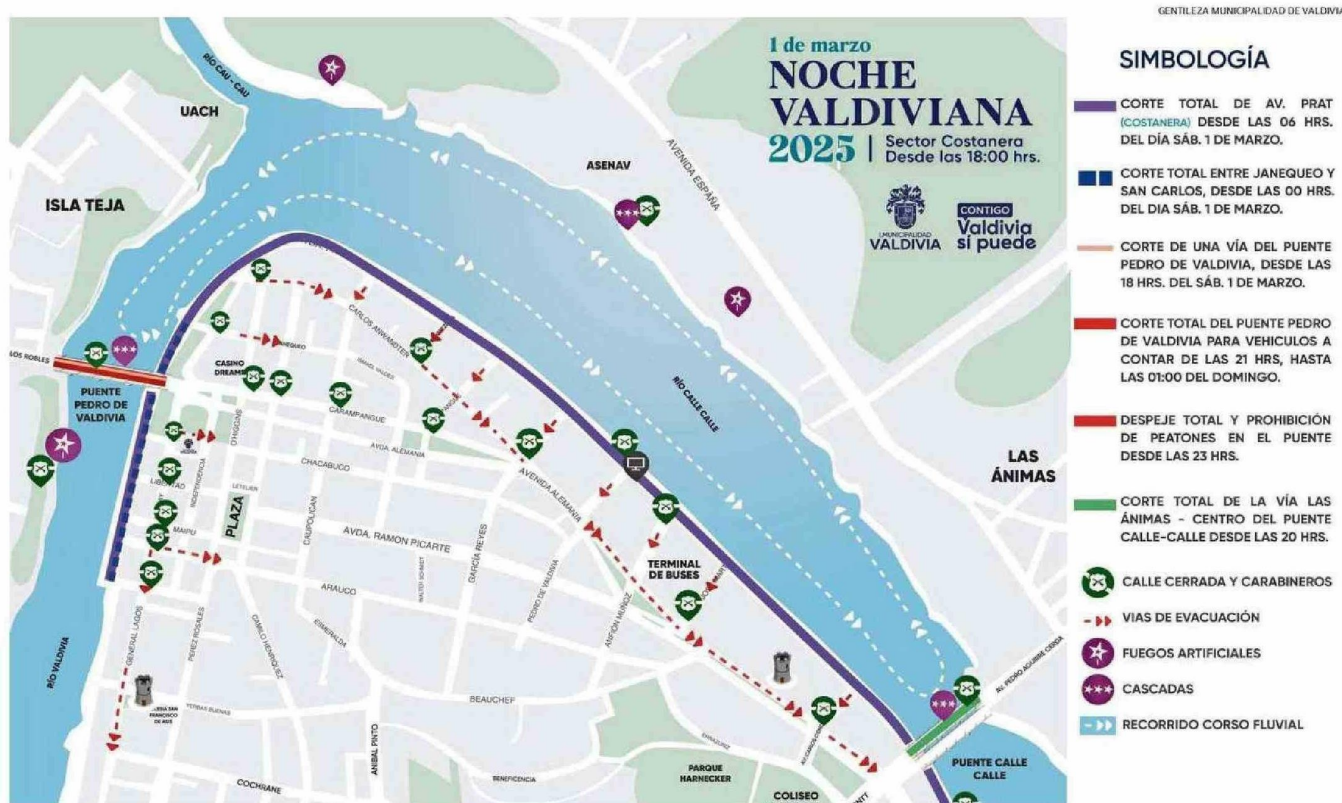
IMAGEN DISEÑADA POR LA MUNICIPALIDAD DE VALDIVIA QUE DA CUENTA DE LOS DISTINTAS ACCIONES INVOLUCRADAS EN LA JORNADA DE CONVOCATORIA MASIVA.

CELEBRACIÓN. Mañana y hasta las 2:00 A.M. del domingo no estará permitido el tránsito vehicular por la Avenida Arturo Prat. Organizadores informaron además de las restricciones que se aplicarán en los puentes Pedro de Valdivia y Calle Calle.