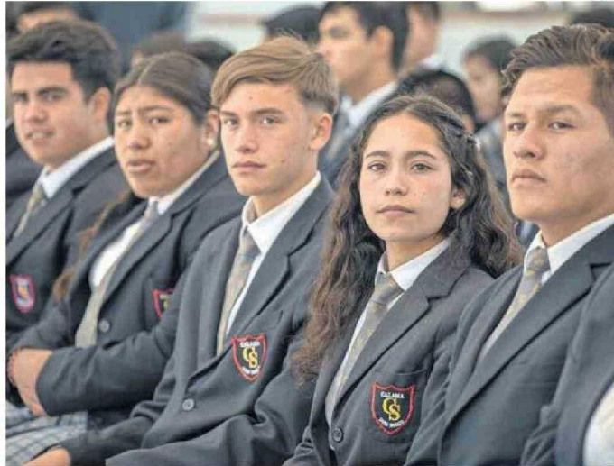
EL 47% DE LOS CUPOS DE LA MATRÍCULA ESTUDIANTIL DEL COLEGIO DON BOSCO, PERTENECE A NIÑAS.

Actualmente, el colegio se encuentra trabajando en su sexta etapa de expansión, que permitirá la implementación de un nuevo patio techado, oficinas directivas y salas de clases. Esto contribuirá al aumento del número de cursos, ampliando la oferta de matrícula. El establecimiento destaca