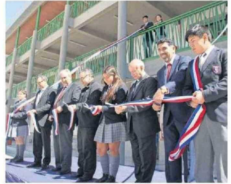
DON BOSCO ES RESULTADO DE UNA ALIANZA PÚBLICO-PRIVADA EXITOSA.

El Colegio se ha distinguido por poseer una formación profesional mixta, en que las mujeres son protagonistas, tal como