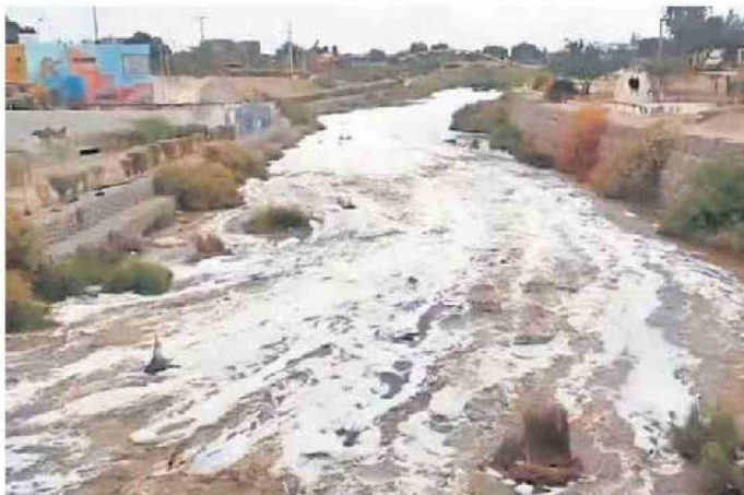
ESTE AÑO LAS LLUVIAS PROVOCARON EL AUMENTO DE LOS CAUDALES DE LOS RÍOS COMO EL RÍO LOA.

En este sentido, Cortés recomendó la instalación de techumbres provisionales para la protección de corrales y la conservación de los fardos de alfalfa en lugares secos y seguros, con el fin de evitar pérdidas en la actividad ganadera. “Poder mantener techumbres provisionales hasta que pueda