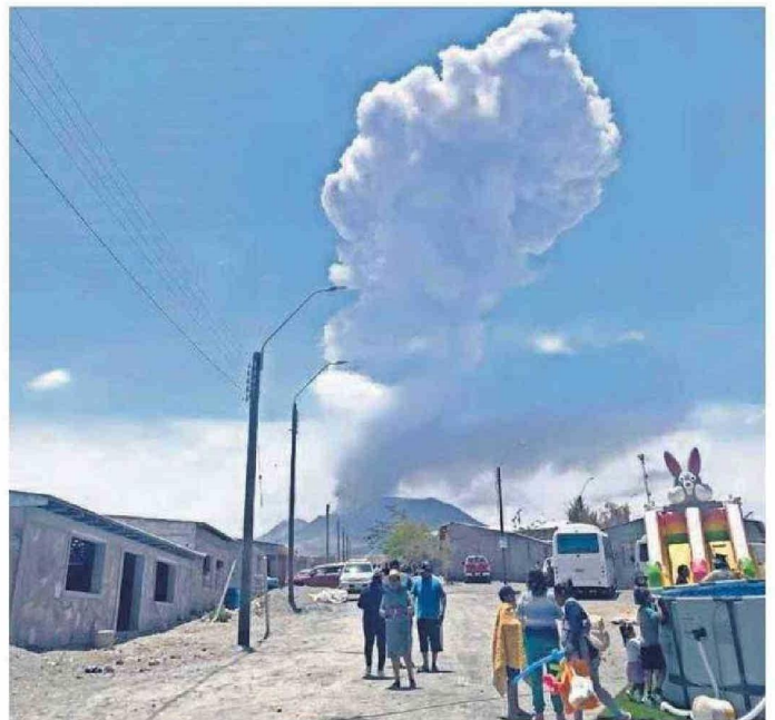
IMAGEN DE LA ÚLTIMA EXPLOSIÓN QUE GENERÓ UNA COLUMNA DE HUMO EN EL VOLCÁN EN 2022.