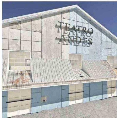
PARTE DE LA PROPUESTA DE 'RECORRIDO VIRTUAL' DE LOS TEATROS.