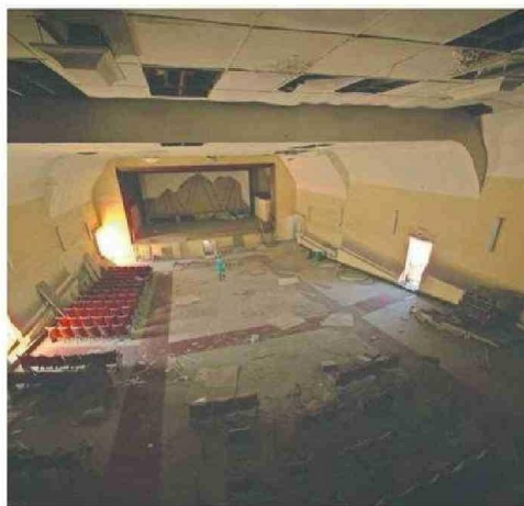
TRABAJO REALIZADO EN LOS ESPACIOS ABANDONADOS INCORPORA NUEVAS TECNOLOGÍAS COMO EL ESCÁNER.