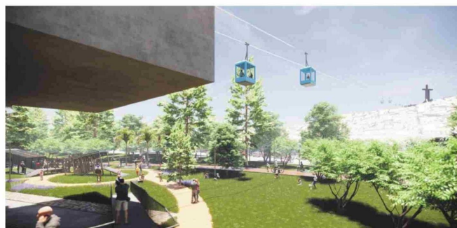
Proyecto Teleférico Coquimbo.