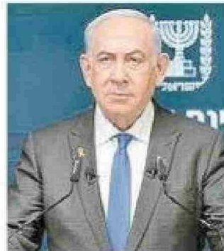
El primer ministro Benjamin Netanyahu.

Entre los que se espera que sean liberados se encuentra el rehén más joven, Kfir Bibas, cuya familia celebró su segundo cumpleaños el sábado. El niño se