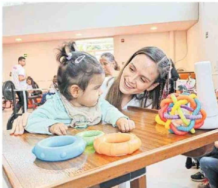
Uno de los logros más destacados es que se dio atención presencial a casi el 100% de los usuarios, priorizando a los menores de 5 años.

El instituto brinda atención gratuita hasta los 20 años cuando la discapacidad es de nacimiento, y hasta los 24 años cuando es adquirida.