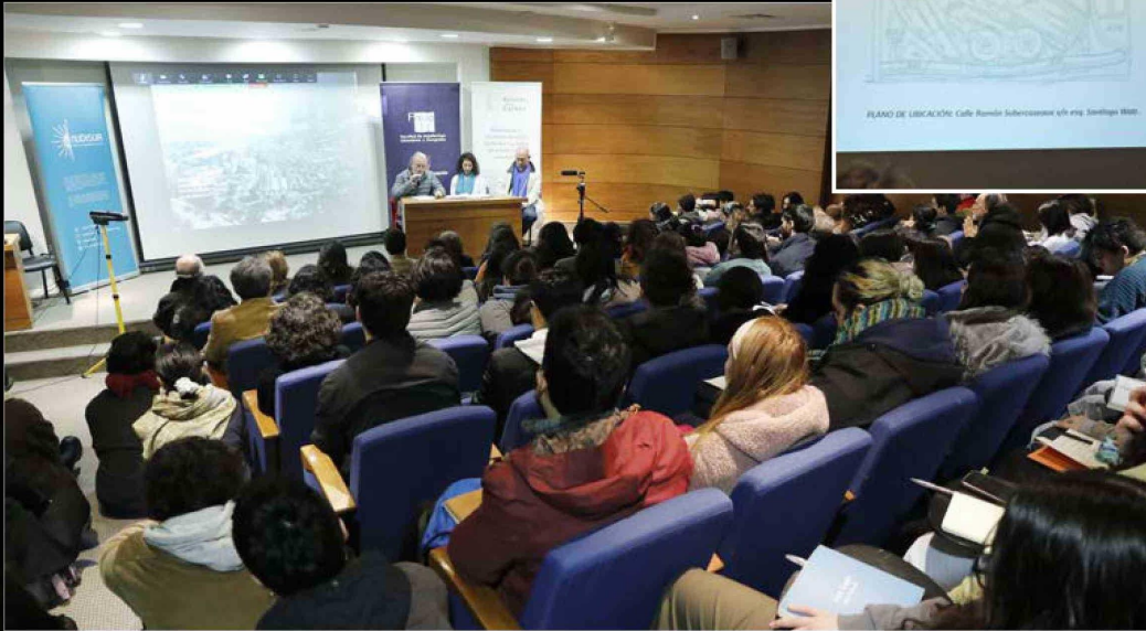
SU CLASE MAGISTRAL EN EL AUDITORIO de la Facultad de Arquitectura, Urbanismo y Geografía de la UdeC suscitó un gran interés por parte de la comunidad universitaria y el público general.

blaciones alrededor del centro industrial que permitía un sinfín de soluciones, ya sea de tiempo, distancia, compromiso con el proceso productivo por parte de esos trabajadores, con el compromiso de esos patrones fuera el Estado o patrones privados de buscar también responder a las necesidades que sus trabajadores tenían.