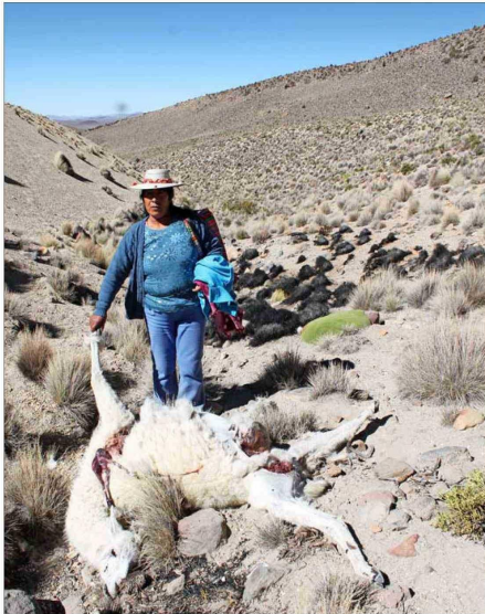
PRINCIPAL SUSTENTO. — Los camélidos, principalmente, son destinados a faenas para el consumo de su carne cuando cumplen dos a tres años de vida.