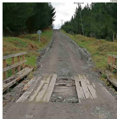
MUCHOS CAMINOS TIENEN PUENTES DE MADERA EN MAL ESTADO.