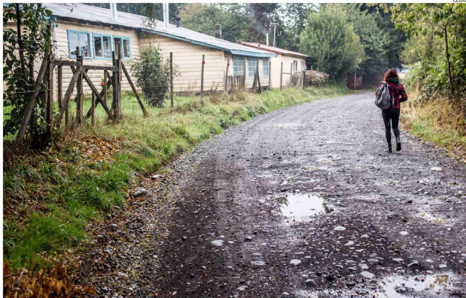
LOS DESPLAZAMIENTOS HACIA ESCUELAS O PUNTOS DE TRABAJO SE COMPLICAN DURANTE EL INVIERNO EN LOS CAMPOS DE LA REGIÓN.

"Los problemas económicos también golpean al campo, porque muchas cosas que antes solucionábamos en verano para pasar un invierno tranquilos, ahora no es posible. Por ejemplo, tener suficientes provisiones para pasar el invierno eso ya no es posible, porque está todo muy caro e incluso tener una chacra resulta complejo, porque tenemos el problema del poco acceso al agua y no sólo potable para el consu-