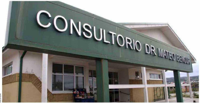
Como "eventuales" calificaron las autoridades de Cormupa las situaciones presentadas en el Cesfam Mateo Bencur.

● Tras las denuncias de vecinos, desde la Corporación Municipal se aclaró la situación para tranquilidad de los usuarios del servicio en el Mateo Bencur.