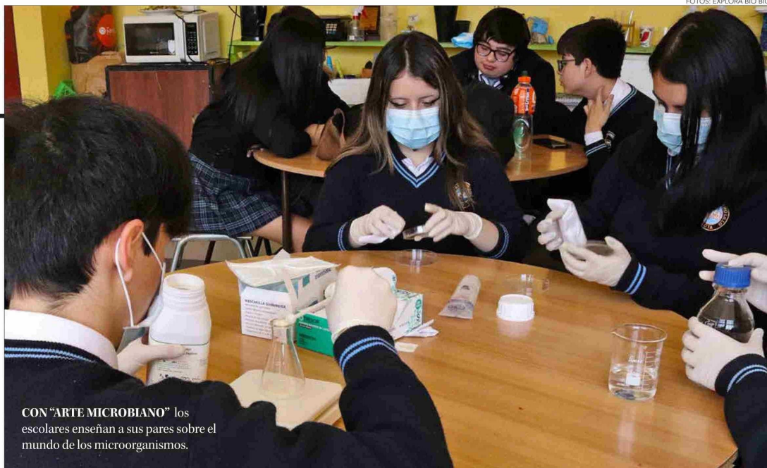
CON "ARTE MICROBIANO" los escolares enseñan a sus pares sobre el mundo de los microorganismos.