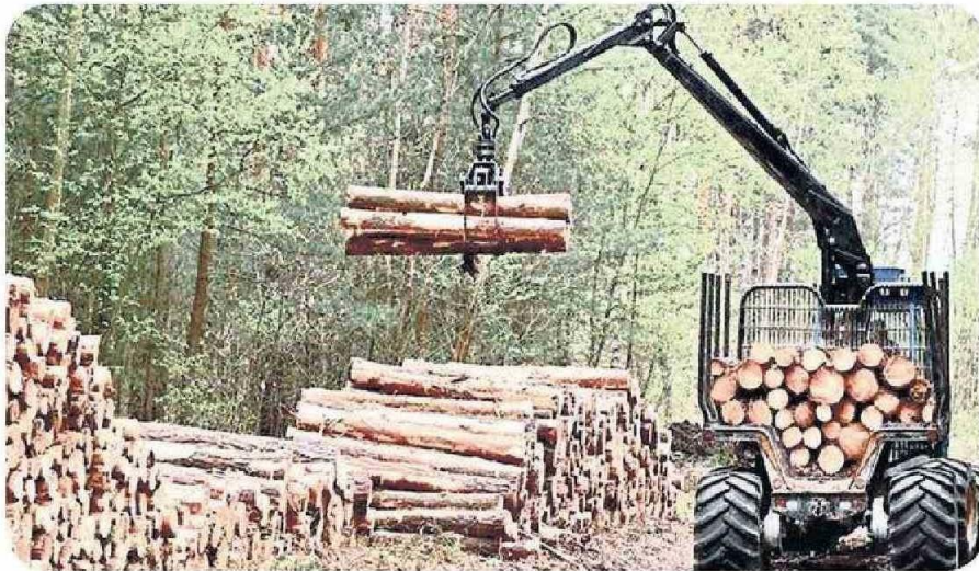
Para Ananías el explorar y fomentar nuevas industrias resulta fundamental en la zona, aquí los tiempos para tramitar inversiones son una de las grandes problemáticas a enfrentar.