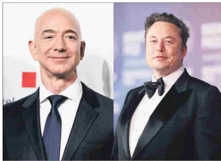
Bezos y Musk han intercambiado palabras de buena crianza.

Los siete motores principales se encendieron al despegar la nave, a eso de las 02:02 am hora local. Bezos siguió el lanzamiento desde el control de misión, y como habitualmente sucede los empleados de Blue Origin comenzaron a aplaudir cuando la nave alcanzó con éxito la órbita 13 minutos después. Eso sí, el propulsor del cohete no logró aterrizar en una