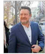
Gobierno regional suscribió contrato con fundación investigada.

REFORMA AL SISTEMA DE NOMBRAMIENTOS INGRESA HOY: MINISTERIO DE JUSTICIA PROPONDRÁ CONSEJO PERMANENTE DE CINCO MIEMBROS Y MANTENER LOS CUPOS DE SUPREMOS "EXTERNOS" | C 2