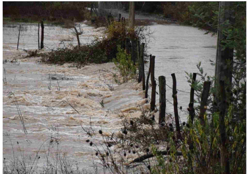
LAS ORGANIZACIONES DE USUARIOS DE AGUA SE VEN imposibilitadas de enfrentar los volúmenes de inversión que implican catástrofes como las causadas por las inundaciones.

recalcó que “frente a estas catástrofes, es imposible que una organización de usuarios, una asociación de canalistas o una comunidad de aguas pueda hacer frente a estos volúmenes de inversión”.