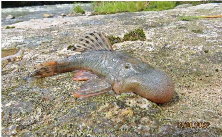
Aún se desconoce la función abultada del pez "cabeza de gota" ( Chaetostoma sp.).