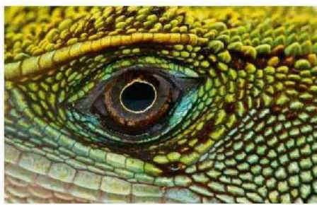
El ojo del lagarto del bosque del Amazonas ( Enyalioides laticeps ).

plantas amenazadas de extinción, incluidas orquídeas raras y otra flora que sólo se encuentra en esta región.