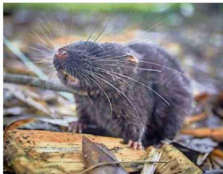
El ratón anfibio ( Chaetostoma sp.).