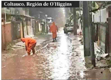
EVACUACIÓN. — La comuna de Coltauco fue uno de los sectores de la Región de O'Higgins que debió ser evacuado por Senapred.