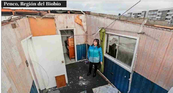
VIENTOS. — Pese a que se pensó que era una tromba marina, el fenómeno que generó daños en Penco se trató de un tornado menor.

“Más de cinco mil personas que habitan en estos sectores complejos han tenido que evacuar”.