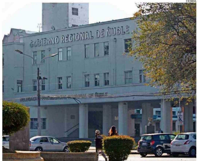
GORE DE ÑUBLE CRARÁ FUNDACIÓN PARA EL DESARROLLO. INICIATIVA GENERA OPINIONES ENCONTRADAS.

"La Corporación Regional para el Desarrollo será una buena instancia en la medida que se cumplan ciertas condiciones que a mi modo de ver son fundamentales. Lo primero es el carácter vinculante de las recomendaciones de esta Corporación con las prioridades del gobernador. No sacamos nada con crear una entidad que proyecte a Ñuble en los próximos años, con proyectos estratégicos, si sus recomendaciones de política pública no son consideradas en la