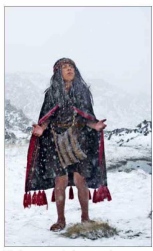
El documental recrea los meses previos a la muerte del niño.