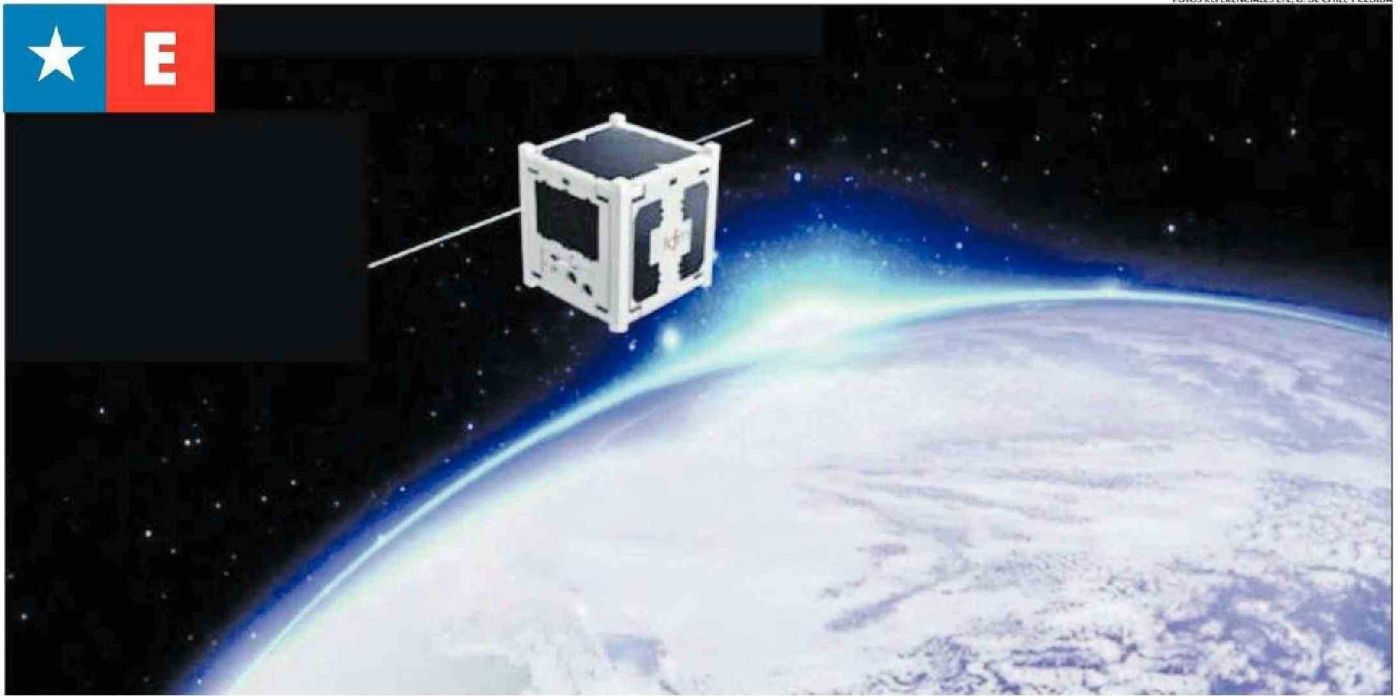
LANZADO EN EL AÑO 2017, EL NANO SATÉLITE SUCHAI-1 DE LA UNIVERSIDAD DE CHILE, FUE EL PRIMERO DE ESTE TIPO DE DISPOSITIVOS DISEÑADO Y DESARROLLADO EN NUESTRO PAÍS.