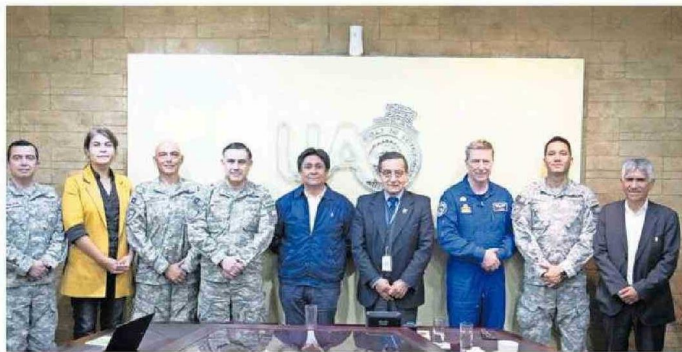
REPRESENTANTES DE LA UA, FACH Y EL GOBIERNO REGIONAL SE REUNIERON PARA COORDINAR EL PROYECTO.

Es por ello que durante estos días se realizó una reunión en la Universidad de Antofagasta (UA), casa de estudios que tendrá la misión de enfocarse en el desarrollo de capital humano y de los diseños de laboratorios para la construcción y operación de satélites de comunicaciones, gracias a la experiencia de sus centros de Investigación, Tecnología, Educación y Vinculación Astronómica (Citeva) o de Fisiología y Medicina de AL-