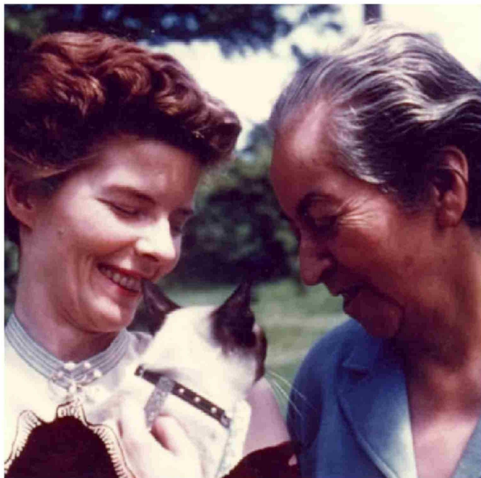
► Gabriela Mistral obtuvo el Premio Nobel de Literatura en 1945.

En suma, incorporar la vida privada de Mis-