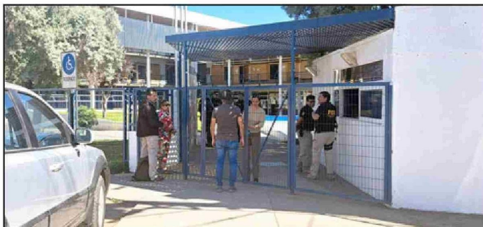
Las diligencias de la Policía de Investigaciones no hallaron artefactos sospechosos, sin embargo, la investigación continúa en curso.