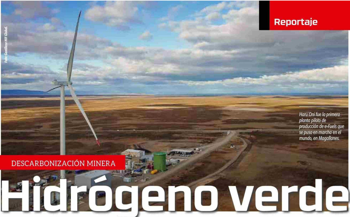
Haru Oni fue la primera planta piloto de producción de e-Fuels que se puso en marcha en el mundo, en Magallanes.