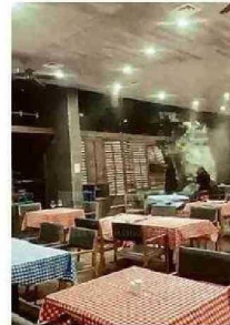
VENTANAL REVENTÓ EN CASINO.

No obstante, la consecuencia más sensible del paso del sistema frontal en la zona fue la muerte de un hombre de 38