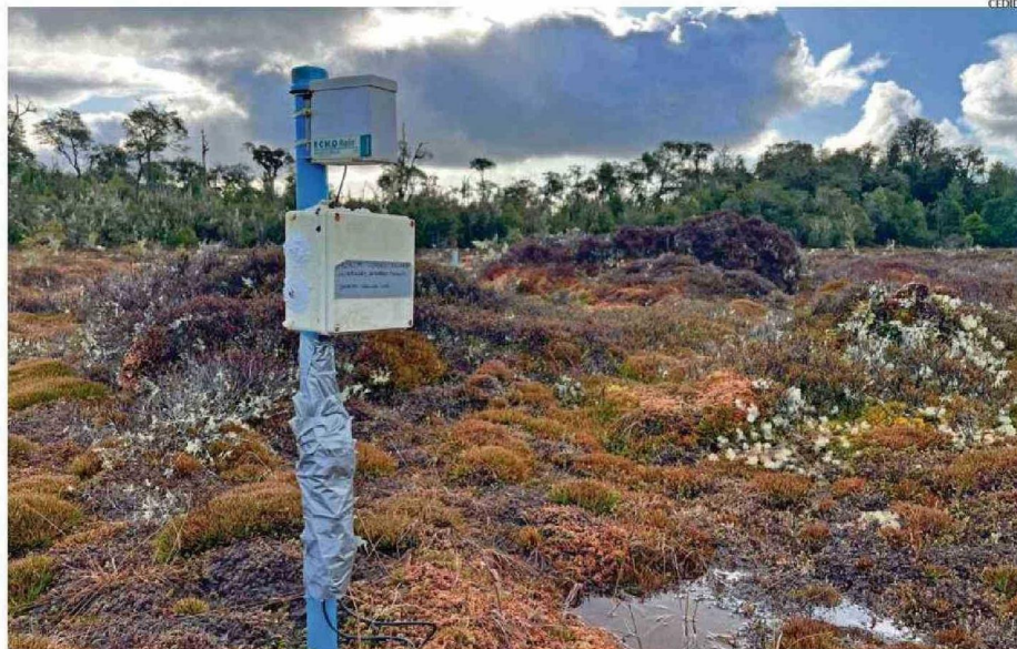
Las turberas son como esponjas naturales que retienen agua en las temporadas de lluvias y luego las liberan en temporadas secas.

"El modelo se enfoca en la conservación, restauración y uso sostenible de las turberas con el objetivo de preservar sus funciones ecológicas. El modelo opera evaluando el estado de una turbera, luego diseñando un plan de manejo que pueda conservar o restaurar las funciones ecológicas, teniendo en cuenta la biodiversidad, las condiciones hidrológicas y las necesidades de las comunidades locales. Posteriormente, se aplica, monitorea y adapta, para evaluar el éxito del manejo regenerativo", explica León a este medio.