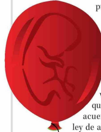
ILUSTRACIÓN: ANDRÉS OREÑA P.

Por su parte, el diputado Roberto Arroyo (PSC), se sumó a las voces contrarias a la iniciativa del Ejecutivo y comentó que “no estoy de acuerdo con una ley de aborto libre y obviamente, nuestro voto será de rechazo, creemos firmemente en el valor de la vida desde el minuto de la concepción, por lo que no está en discusión cuál será nuestra postura”.