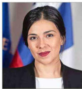
Karol Cariola Presidenta de la Cámara de Diputadas y Diputados

Matrona, lleva 10 años como diputada. Actualmente preside la Cámara de Diputadas y Diputados. Cariola es la quinta mujer en ocupar el cargo, además de ser la más joven en esa posición, demostrando que vivir un embarazo "no nos imposibilita" para continuar nuestras labores, dice. Desde la legislativa, ha tenido un rol activo en la rebaja laboral a 40 horas, la tarifa de invierno, Ley Gabriela, la rebaja a la tarifa del pasaje al adulto mayor, entre otras, todas normativas ya aprobadas y/o en vigencia. Otros proyectos de su autoría en tramitación son el de equidad salarial y el que elimina las preexistencias.