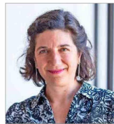
Aisén Etcheverry Ministra de Ciencia, Tecnología, Conocimiento e Innovación