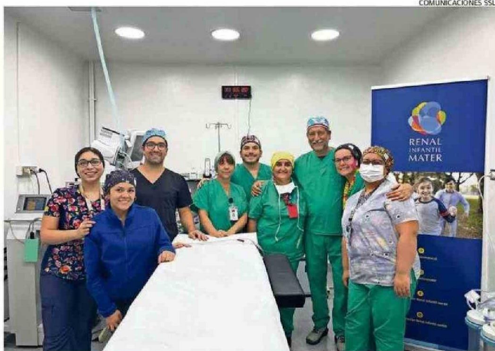
PARTE DEL EQUIPO DE PROFESIONALES QUE TRABAJÓ EN EL OPERATIVO DEL FIN DE SEMANA.

La directora del SSLR también explicó que este esfuerzo