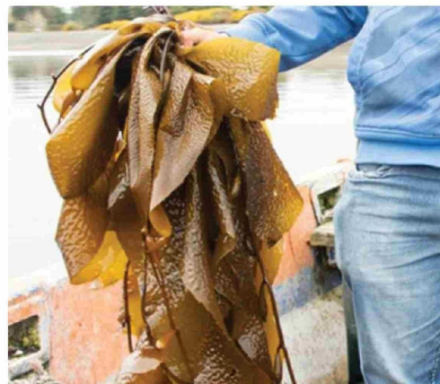
CHILE CUENTA CON ALREDEDOR DE 400 ESPECIES de algas bentónicas, de las cuales solamente 14 se utilizan con fines comerciales, dejando el potencial de estudiar macroalgas.